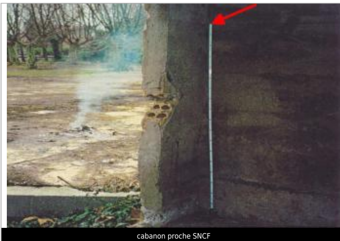
cabanon proche SNCF

Coordonnées WGS84 : X: 2.75793110 / Y: 43.19725300