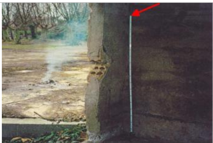
cabanon proche SNCF

Altitude calculée de l'eau (en m) : 49.96 m