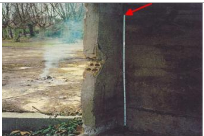
cabanon proche SNCF

Altitude calculée de l'eau (en m) : 49.96