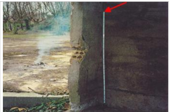
cabanon proche SNCF