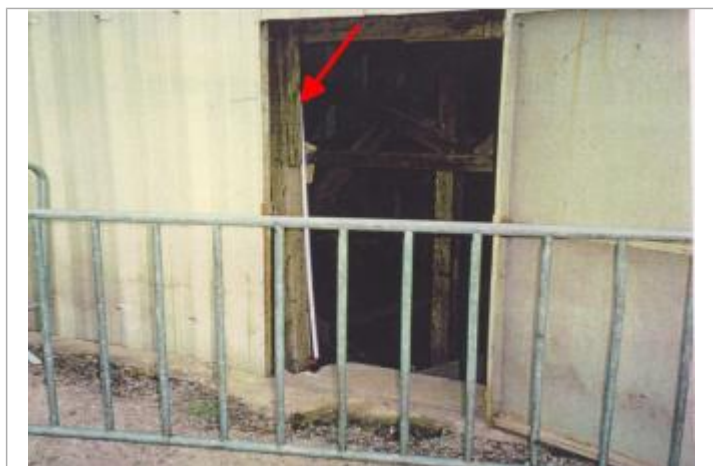
dalle sous les gradins

Altitude calculée de l'eau (en m) : 50.27 m