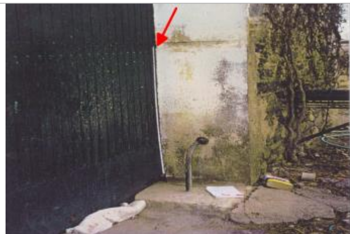
seuil porte garage

Altitude calculée de l'eau (en m) : 50.9