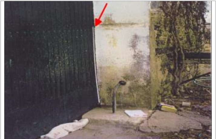
seuil porte garage