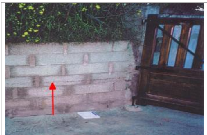
Laisse de crue sur muret