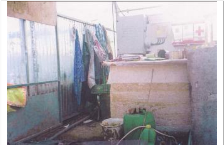
Mur de la banque

GÉOLOCALISATION Coordonnées WGS84 : X: 2.74369080 / Y: 43.19212000 Coordonnées RGF93 (Lambert 93) X: 679151 / Y: 6232578.02 Coordonnées RGF93 (ETRS89) : X: 2.7436908 / Y: 43.19212 Code Hydro: Y1450560 Rive de référence: