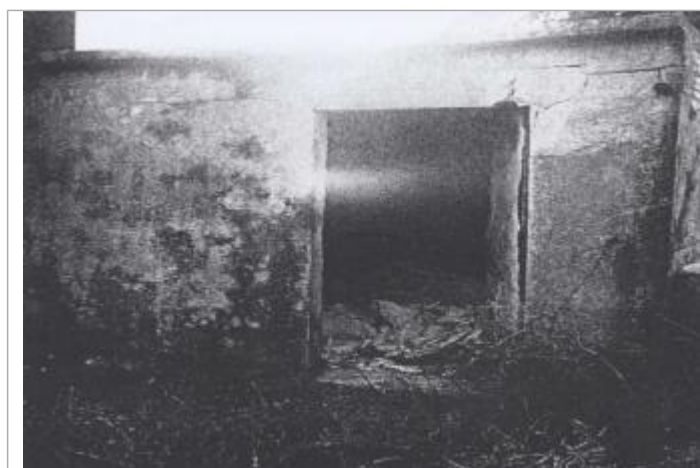
Dalle de porte

Système altimétrique : NGF IGN 1969 (système normal) Différence entre le niveau d'eau et la référence (en m) : 0.210 m