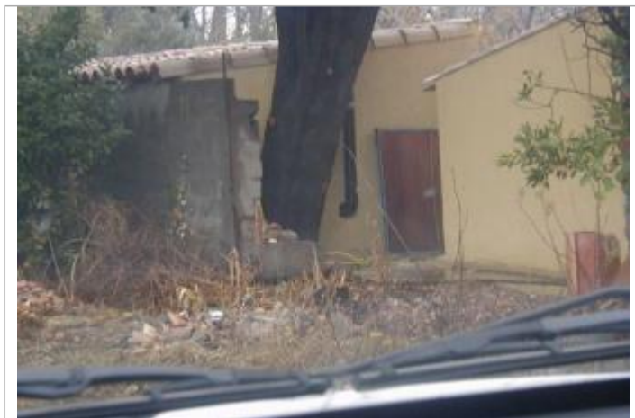
Façade de maison