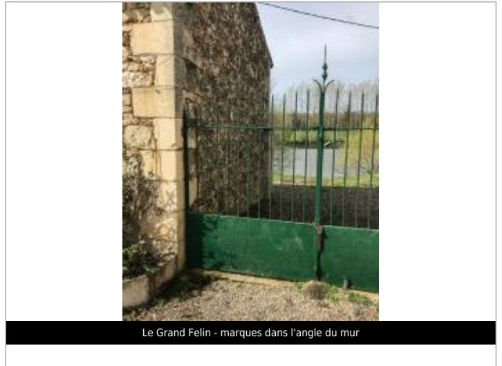
Le Grand Felin - marques dans l'angle du mur