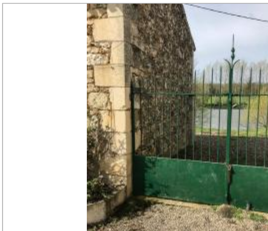
Le Grand Felin - marques dans l'angle du mur

Coordonnées WGS84 : X: 0.59047016 / Y: 46.63200100