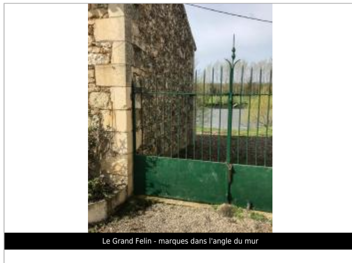
Le Grand Felin - marques dans l'angle du mur