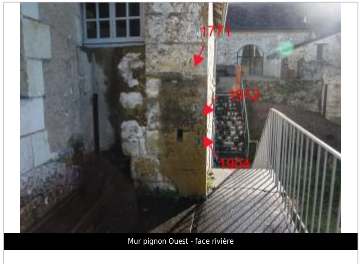
Mur pignon Ouest - face rivière