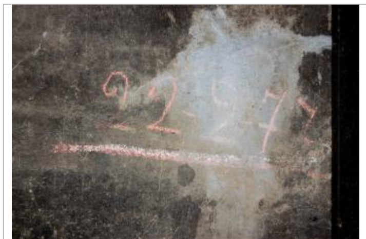
Marque février 1977

Texte : 22-2-77 Maximum de l'inondation : Non renseigné Visibilité : Oui État du repère : Bon Pérennité : Longue Repère calculé : Non PHEC : Non