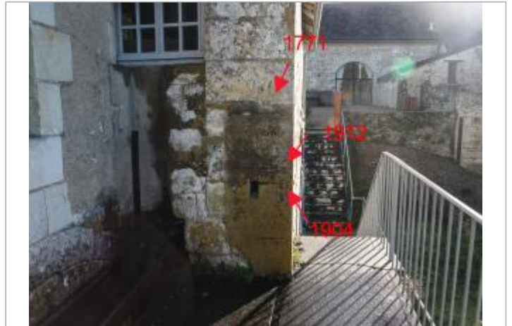
Mur pignon Ouest - face rivière