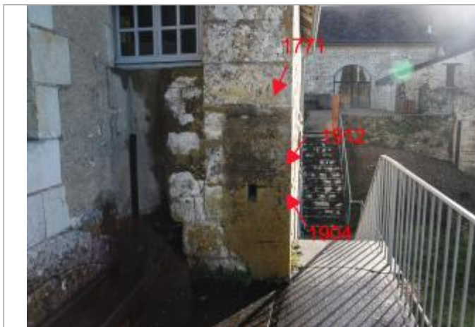
Mur pignon Ouest - face rivière