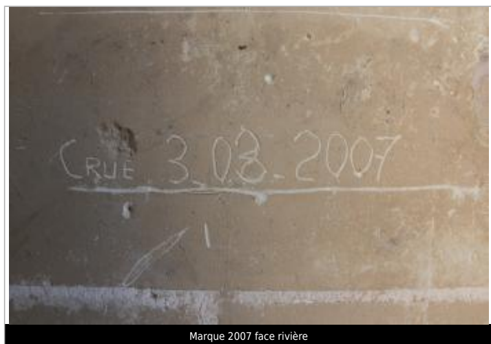
Marque 2007 face rivière

Texte : Crue 3.03.2007 Maximum de l'inondation : Non renseigné Visibilité : Oui État du repère : Bon Pérennité : Longue Repère calculé : Non PHEC : Non