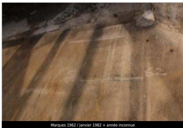
Marques 1962 / janvier 1982 + année inconnue