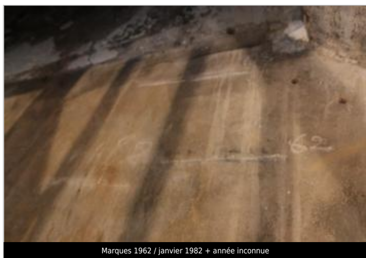
Marques 1962 / janvier 1982 + année inconnue

Code : WEB_R_201804052624 Date de mise à jour : Auteur : EPTB_Vienne 05/08/2018