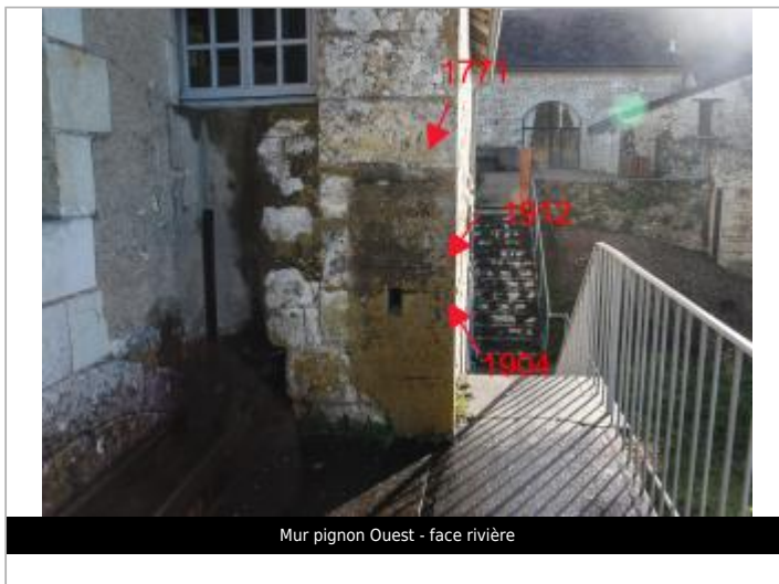
Mur pignon Ouest - face rivière