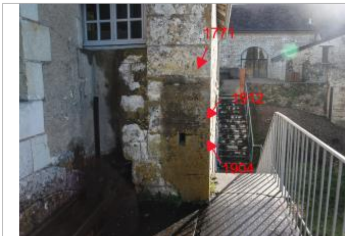
Mur pignon Ouest - face rivière