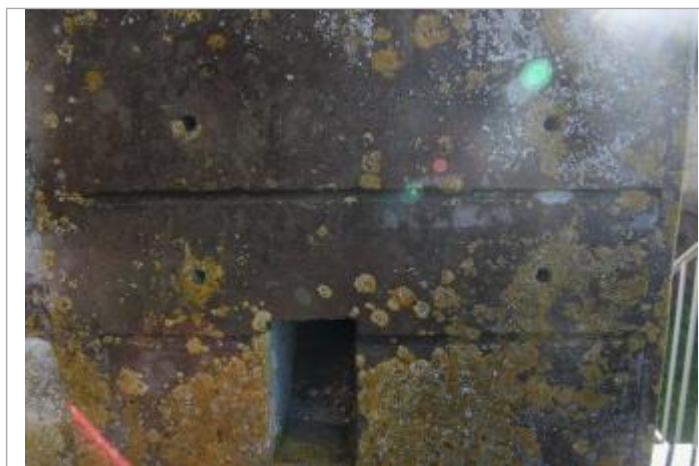
Marques 1904 (bas) et 1912 (haut)

Altitude calculée de l'eau (en m) : 54.691 m