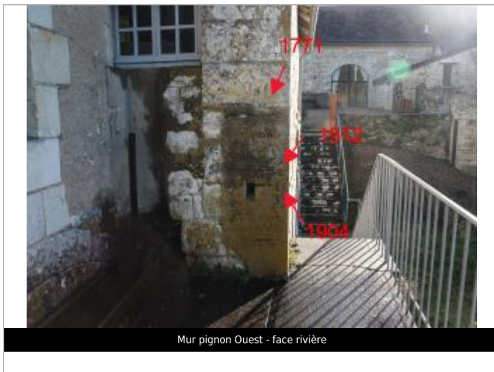
Mur pignon Ouest - face rivière