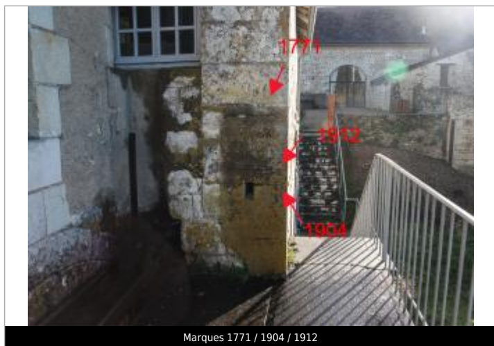
Marques 1771 / 1904 / 1912

Altitude calculée de l'eau (en m) : 54.561 m