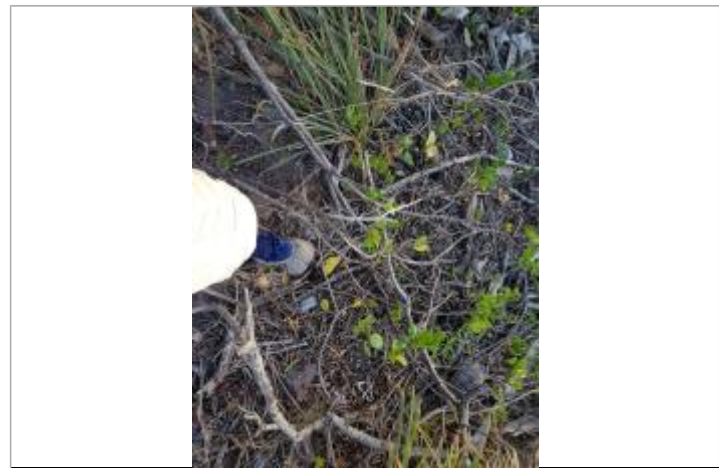
Vue de la PHE - Auteur : Cerema et témoignages

GÉNÉRAL Code : Cer_IRMA_R_255_1 Date de mise à jour : 17/02/2021 Auteur : Cerema Méditerranée