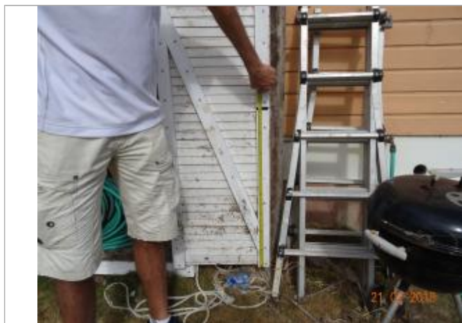
Vue de la PHE - Auteur : Cerema et témoignages

SOURCE DE REPÉRAGE : CEREMA MISSION IRMA ST-BARTH - 24/02/2018