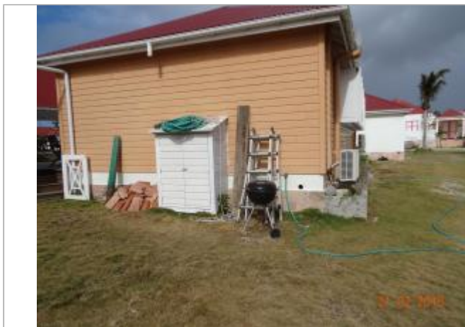
Vue du site - Auteur : Cerema et témoignages