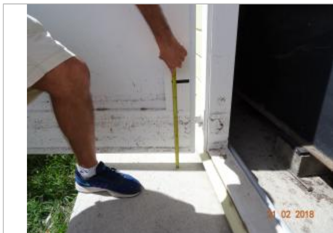
Vue de la PHE

Altitude calculée de l'eau (en m) : 2.26 m