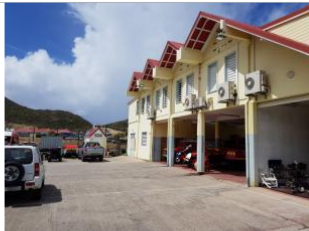
Vue du site - Auteur : Cerema et témoignages