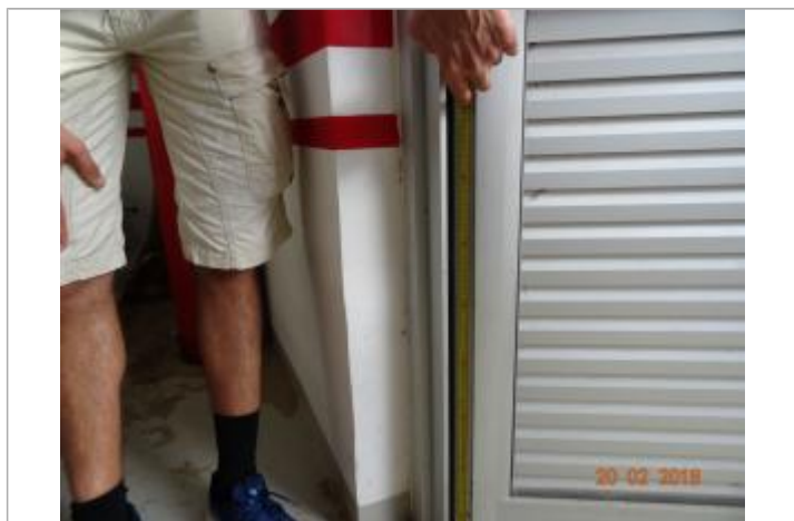
Vue de la PHE - Auteur : Cerema et témoignages

Altitude calculée de l'eau (en m) : 3.485 m