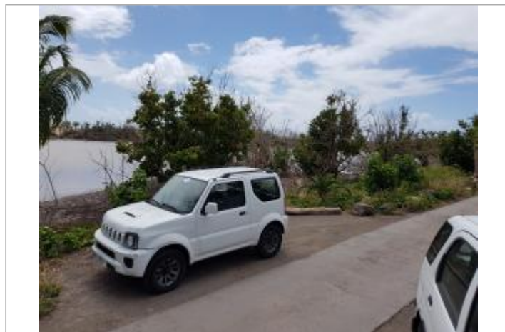
Vue du site - Auteur : Cerema et témoignages

GÉOLOCALISATION Coordonnées WGS84 : X: -62.79718400 / Y: 17.89887370 (RRAF 91)UTM 20N X: 521482.87 / Y: 1979009.06 Coordonnées RGF93 (ETRS89) : X: -62.797184 / Y: 17.8988737 Code Hydro: _OATLANT Rive de référence: Non renseigné