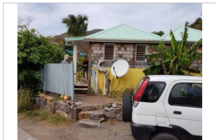
Vue de la PHE - Auteur : Cerema et témoignages

MARQUE Maximum de l'inondation : Oui Visibilité : Non État du repère : Disparu Pérennité : Aucune Repère calculé : Non renseigné PHEC : Non renseigné