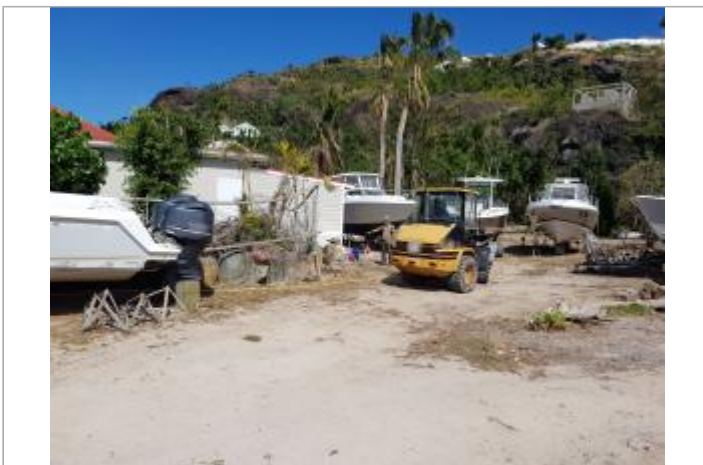
Vue du site - Auteur : Cerema et témoignages

GÉOLOCALISATION Coordonnées WGS84 : X: -62.82051200 / Y: 17.90791170 (RRAF 91)UTM 20N X: 519010.93 / Y: 1980006.45 Coordonnées RGF93 (ETRS89) : X: -62.820512 / Y: 17.9079117 Code Hydro: _OATLANT Rive de référence: Non renseigné