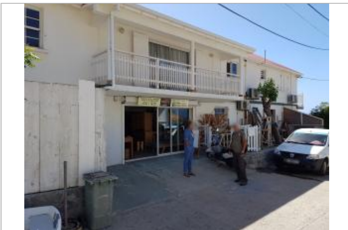
Vue du site - Auteur : Cerema et témoignages

GÉNÉRAL Unité de gestion : Guadeloupe Code : Cer_IRMA_S_242 Date de mise à jour : 03/09/2019 Auteur : Cerema Méditerranée