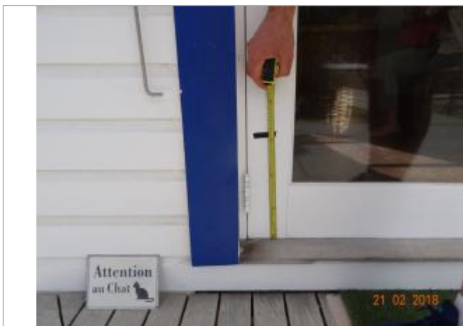
Vue de la PHE

Altitude calculée de l'eau (en m) : 3.023