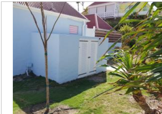
Vue du site - Auteur : Cerema et témoignages