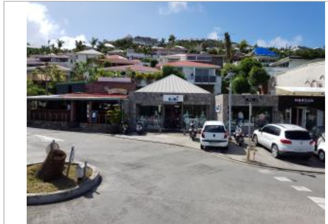
Vue du site - Auteur : Cerema et témoignages

Coordonnées WGS84 : X: -62.83372600 / Y: 17.90109650