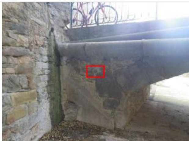
Macaron face aval du pont

Altitude calculée de l'eau (en m) : 196.26