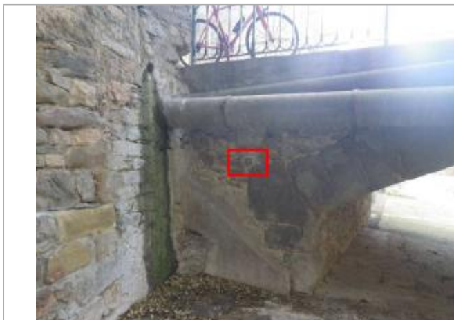
Macaron face aval du pont

Coordonnées RGF93 (ETRS89) : X: 2.5584209 / Y: 43.129096