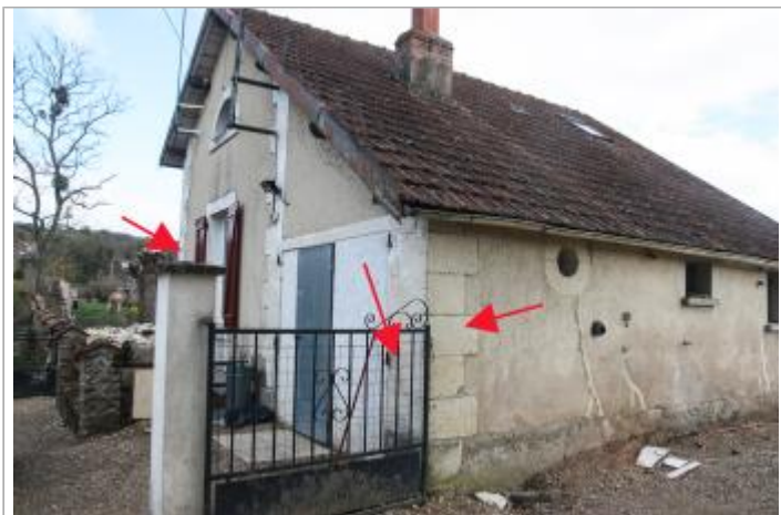
Repères au lieu dit "Le Roc"