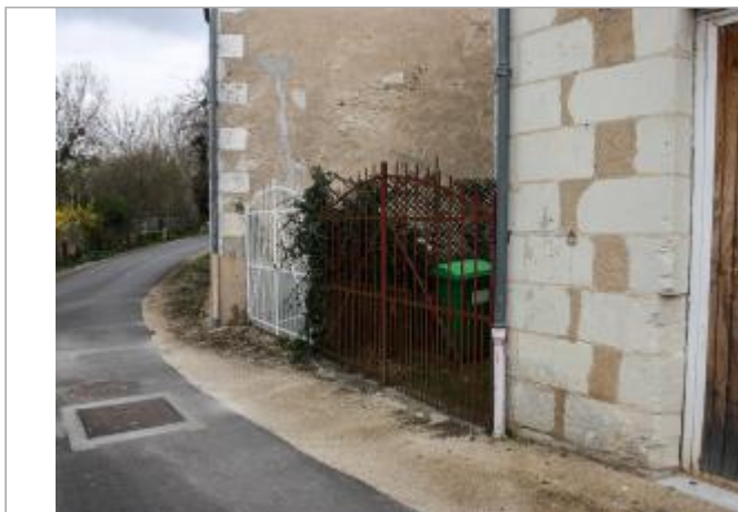
Repères sur le mur du 1 rue des petites rivières