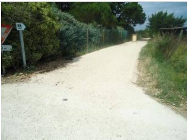
Repère Xynthia - Chemin rural

Méthode : GPS Commentaires sur le nivellement : Nivellement réalisé par un géomètre expert Référence nivelée : Marque d'inondation Système altimétrique : NGF IGN 1969 (système normal) Altitude de la référence (en m) : 5.390 m Altitude calculée de l'eau (en m) : 5.39 m