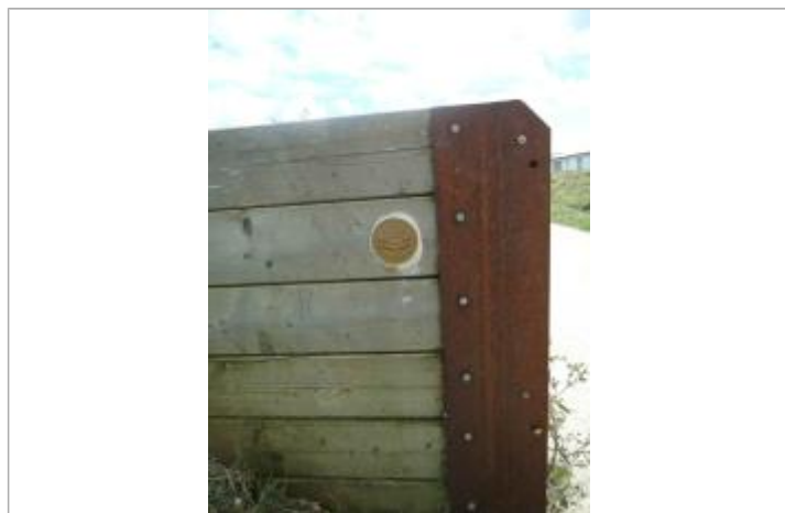
Repère Xynthia - Route du Pertuis

Méthode : GPS Commentaires sur le nivellement : Nivellement réalisé par un géomètre expert Référence nivelée : Marque d'inondation Système altimétrique : NGF IGN 1969 (système normal) Altitude de la référence (en m) : 4.540 m Altitude calculée de l'eau (en m) : 4.54