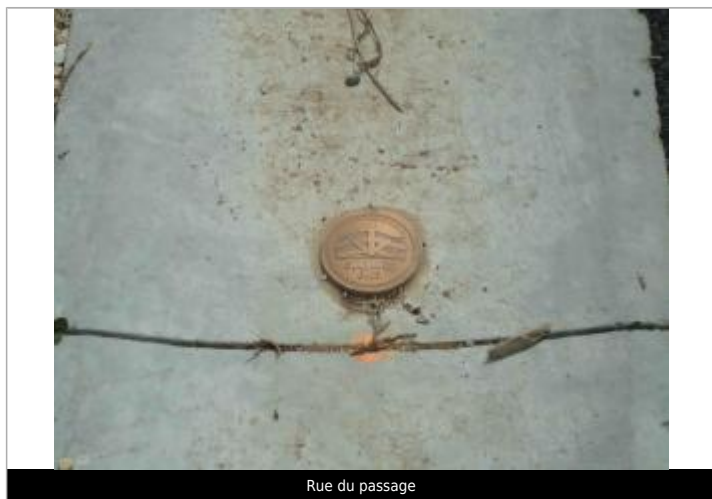
Rue du passage

Méthode : GPS Commentaires sur le nivellement : Nivellement réalisé par un géomètre expert Référence nivelée : Marque d'inondation Système altimétrique : NGF IGN 1969 (système normal) Altitude de la référence (en m) : 3.890 m Altitude calculée de l'eau (en m) : 3.89 m