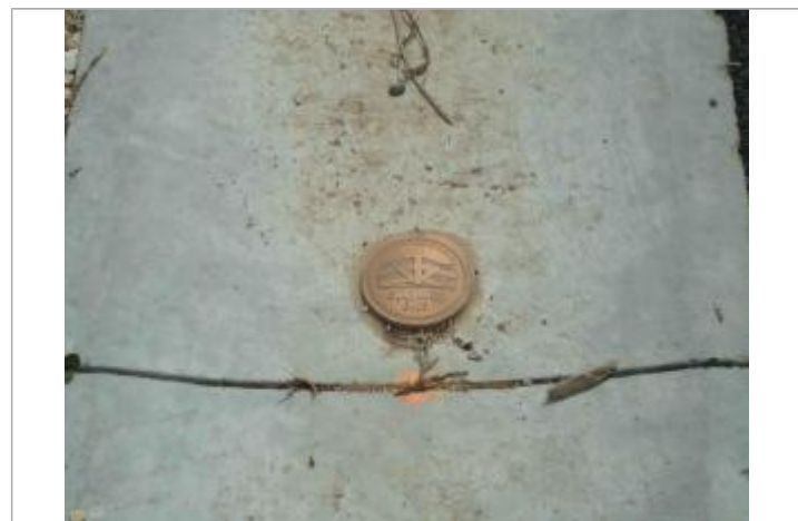
Rue du passage

GÉNÉRAL Code : WEB_R_201803303022 Date de mise à jour : 06/06/2018 Auteur : Communauté de Communes Ile de Re