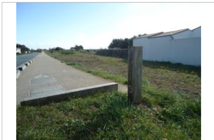
Repère Xynthia - Route du Pertuis

Méthode : GPS Commentaires sur le nivellement : Nivellement réalisé par un géomètre expert Référence nivelée : Marque d'inondation Système altimétrique : NGF IGN 1969 (système normal) Altitude de la référence (en m) : 4.850 m Altitude calculée de l'eau (en m) : 4.85