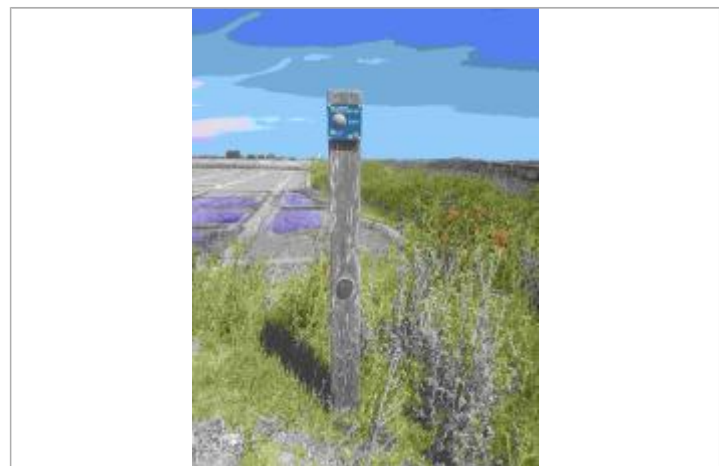
Repère Xynthia - Ecomusée