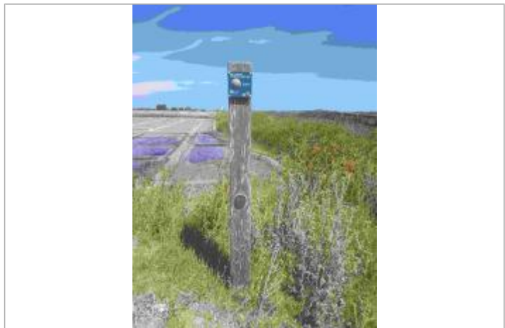
Repère Xynthia - Ecomusée

GÉNÉRAL Code : WEB_R_201803301327 Date de mise à jour : 06/06/2018 Auteur : Communauté de Communes Ile de Re