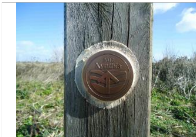
Repère Xynthia - Piste du sel

Méthode : GPS Commentaires sur le nivellement : Nivellement réalisé par un géomètre expert Référence nivelée : Marque d'inondation Système altimétrique : NGF IGN 1969 (système normal) Altitude de la référence (en m) : 3.550 m Altitude calculée de l'eau (en m) : 3.55 m