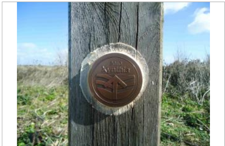
Repère Xynthia - Piste du sel

GÉNÉRAL Code : WEB_R_201803300516 Date de mise à jour : 06/06/2018 Auteur : Communauté de Communes Ile de Re