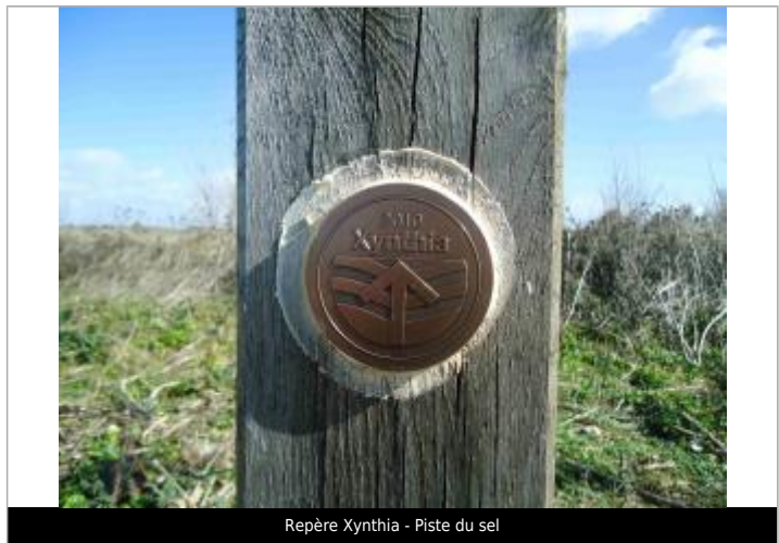
Repère Xynthia - Piste du sel

GÉNÉRAL Code : WEB_R_201803300516 Date de mise à jour : 06/06/2018 Auteur : Communauté de Communes Ile de Re