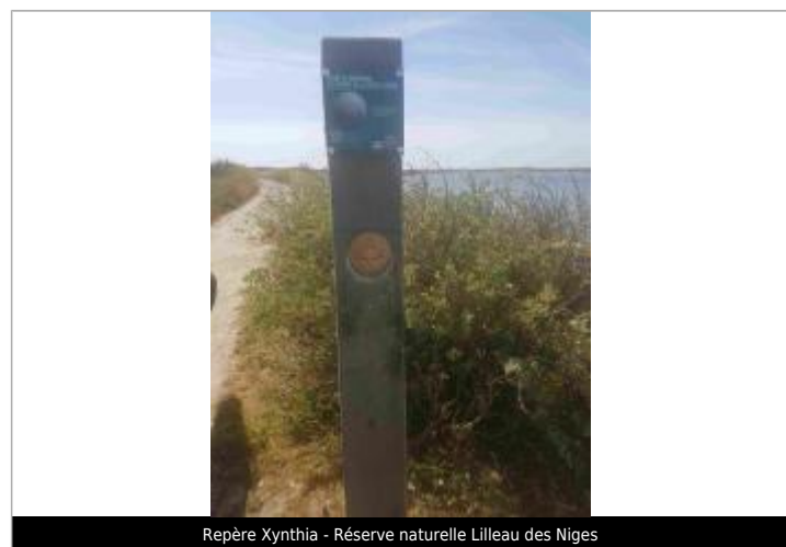
Repère Xynthia - Réserve naturelle Lilleau des Niges

GÉNÉRAL Code : WEB_R_201803302401 Date de mise à jour : 06/06/2018 Auteur : Communauté de Communes Ile de Re