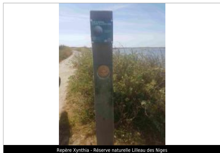
Repère Xynthia - Réserve naturelle Lilleau des Niges