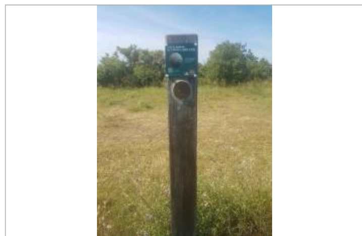
Repère Xynthia - Rue de la Grande Jetée

GÉNÉRAL Code : WEB_R_201803305519 Date de mise à jour : 06/06/2018 Auteur : Communauté de Communes Ile de Re