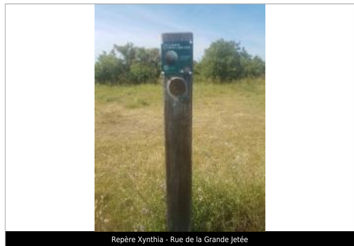
Repère Xynthia - Rue de la Grande Jetée