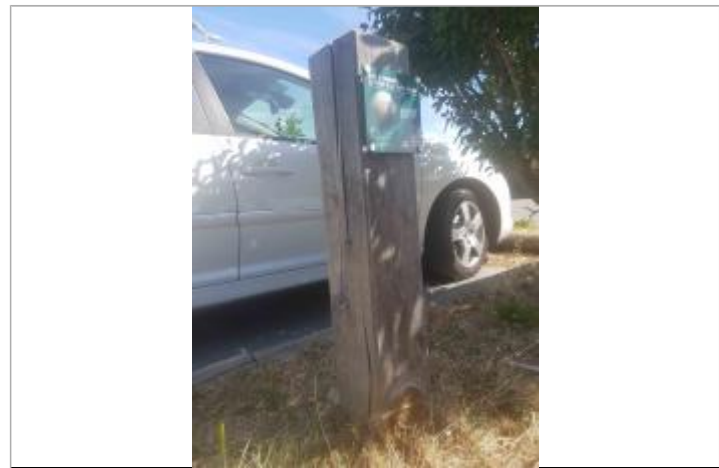
Repère Xynthia - Parking La Patatche

GÉNÉRAL Code : WEB_R_201803305052 Date de mise à jour : 06/06/2018 Auteur : Communauté de Communes Ile de Re