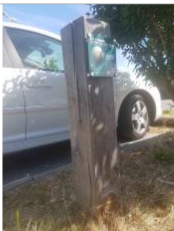
Repère Xynthia - Parking La Patache

Méthode : GPS Commentaires sur le nivellement : Nivellement réalisé par un géomètre expert Référence nivelée : Marque d'inondation Altitude de la référence (en m) : 3.820 m Altitude calculée de l'eau (en m) : 3.82