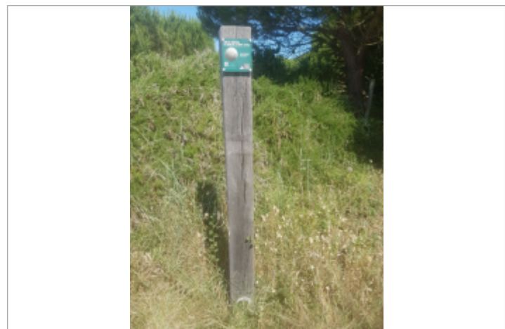
Repère Xynthia - Golf