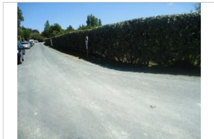
Repère Xynthia - Route de La Levée Verte

GÉNÉRAL Code : WEB_R_201803302621 Date de mise à jour : 06/06/2018 Auteur : Communauté de Communes Ile de Re