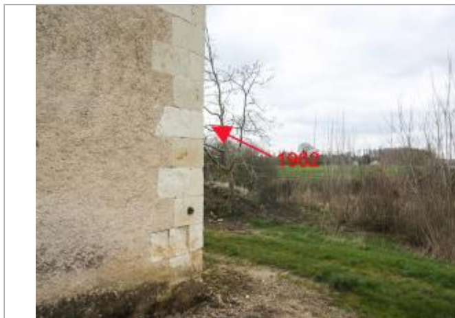
Angle côté rivière (1)