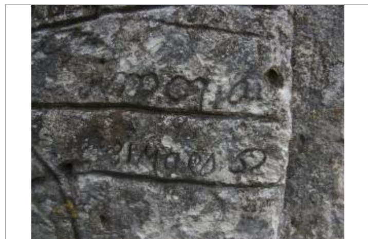
Marque 31 mars 1962