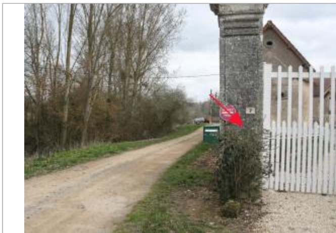
Pilier d'entrée - ferme au Rudepaire